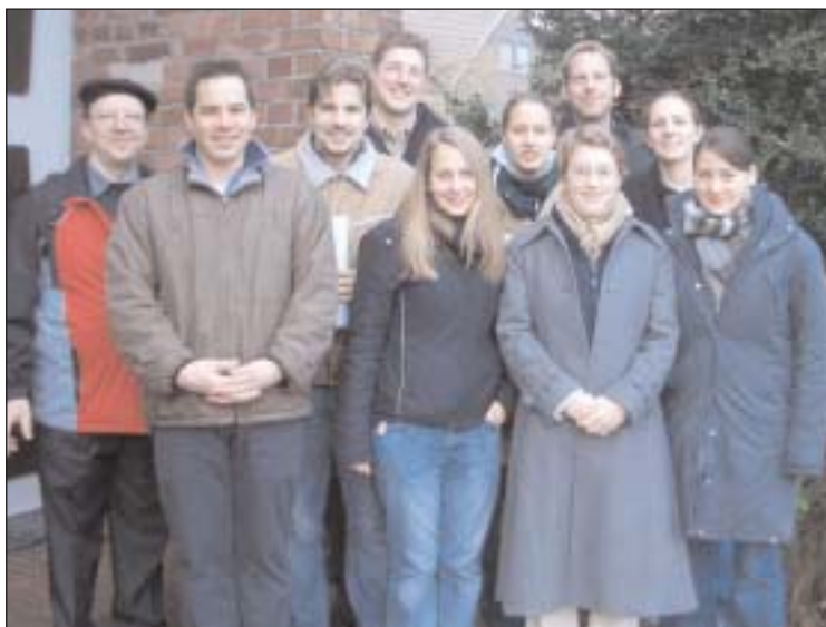
Kernteam Ippendorf - Venusberg