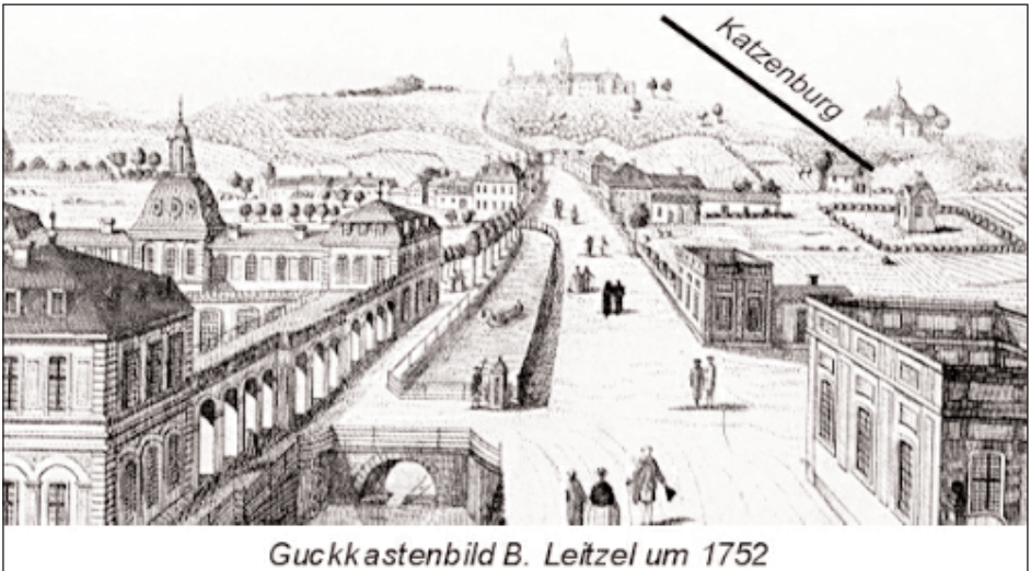
Guckkastenbild B. Leitzel um 1752

Clemens August und die ‚Porcellain Fabrick‘ an der Katzenburg 1755