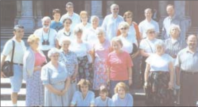
Studienfahrt nach Rom im Juni 1990.

Wie zu allen Kolping-Veranstaltungen sind auch hier Gäste herzlich willkommen und gerne gesehen! Der Familientag beginnt um 11.00 Uhr mit einer Heiligen Messe im Grünen. Anschließend steht der Grill für mitgebrachte Steaks oder Würstchen bereit. Für Getränke wird gesorgt, für gutes Wetter ist der Präses verantwortlich. Nachmittags locken selbstgebackene Kuchen, für die Kinder steht die Spielekiste bereit.